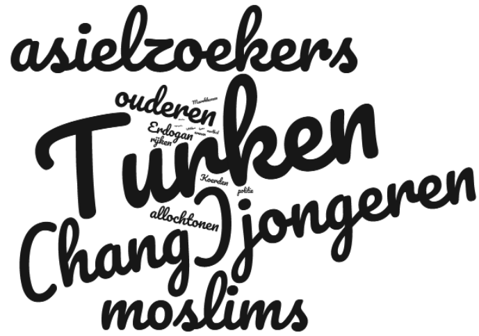
Figuur 2 Woordenwolk van gebeurtenissen en emoties